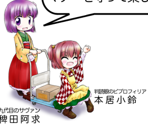
九代目のサブタン 稗田阿求

会場では ・押さない ・走らない ・通路で立ち止まらない マナーを守って楽しい一日を!